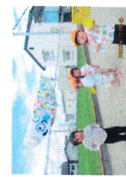
こいのぼり製作(分園)