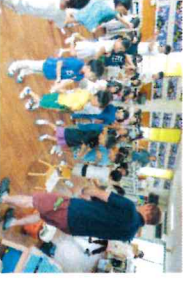
泉の丘中 職場体験(英語教室)