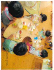
バイキング給食 分園