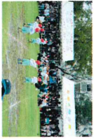
運動会 かけっこ1歳児